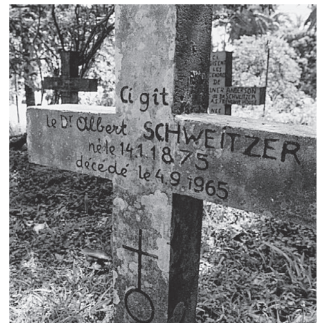
Das Grab Schweitzers in Lambarene, Gabun

Der Zweck des menschlichen Lebens ist es, zu dienen und Mitgefühl und den Willen zu zeigen, anderen zu helfen.»